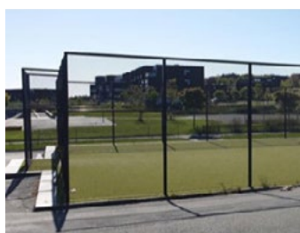
Ballbinger og ballfangernett

Garda Sikring leverer et bredt utvalg av produkter og sikringsløsninger som er egnet til bruk innen idrett og sport. Dette er alt fra enkel og fleksibel sikring med flyttbare gjerder, til automatiserte bommer for styring av trafikk på større arenaer. I tillegg til de ulike sikringsløsningene, leverer vi også andre produkter som naturlig hører til på ulike anlegg. Blant annet har vi egne fabrikker i Norge som produserer fotballmål, flettverk og granulatoppsamlere. Gjennom våre 10 avdelinger leverer og monterer vi løsningene over hele landet. Vi er med andre ord en tilnærmet komplett leverandør av det man måtte trenge for sikring og bruk av idrettsanlegg, både store og små. Kontakt oss for mer informasjon og pris.