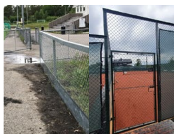
Gjerder og porter