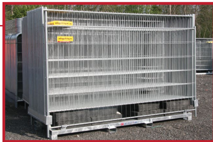
KP30 har plass til både gjerder, føtter og klammere. Rommer 30 stk gjerder av type Basis/Lux og 26 stk av Smartpanel.