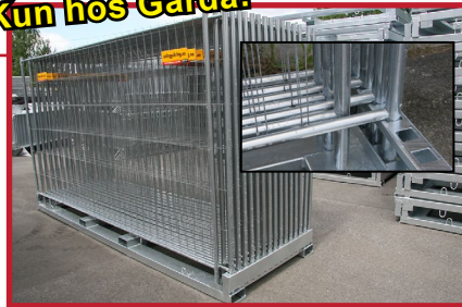
TP30 har plass til 30 gjerder, uansett type. Unik festeanordning for enklere og raskere montering av gjerdene.