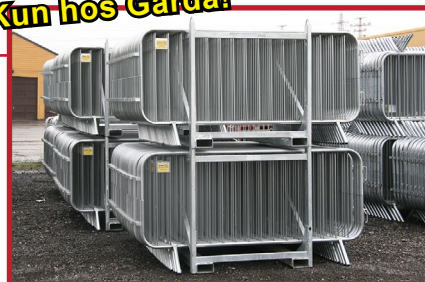
Pall for alle typer sperregjerder. Plass til opptil 50 gjerder. Pallene kan stables i høyden.