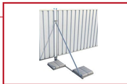
Wind Breaker støttestag med f.eks. betongheller som motvekt. Vårt beste stag ved behov for ekstra god sikring.