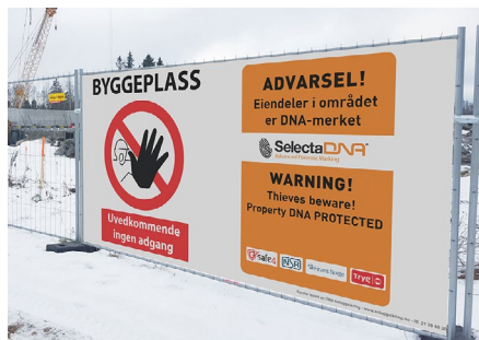
Bruk av dekkduk gir god profilering/informasjon. På grunn av lite luftgjennomstrømming kreves ekstra sikring slik at de ikke velter.