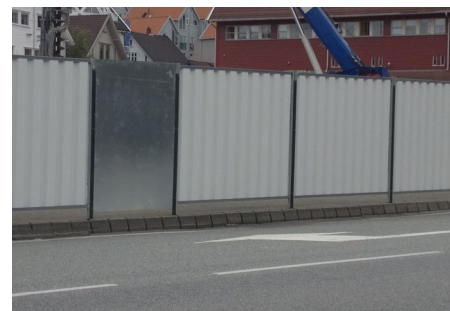
Tette byggegjerder hindrer innsyn til byggeplassen og er perfekte til bruk i bystrøk. Gjerdene gir stort vindfang, og god sikring er påkrevd.

Størst på mobile sikringssystemer i hele Norge!