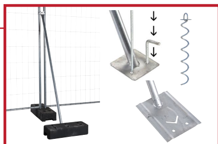
Stag 1071 festes til bakken ved hjelp av to feste-pinner (1011 el. 1669). Stag 1010 har større plate og kan festes enten med pinner, v-formet jordspyd eller med fotføtter på platen som motvekt.