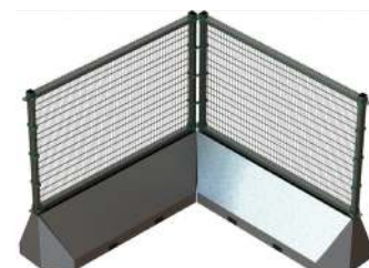
Hjørne-element kan leveres.