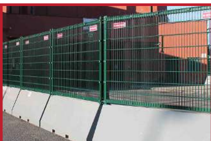
Gjerdet med 2D nettingpanel. Egnert på steder med behov for ekstra høy sikring. Kan påmonteres duk med logo-trykk, informasjon etc.