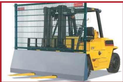
Åpning for gaffler gjør det enkelt å flytte gjerdene.