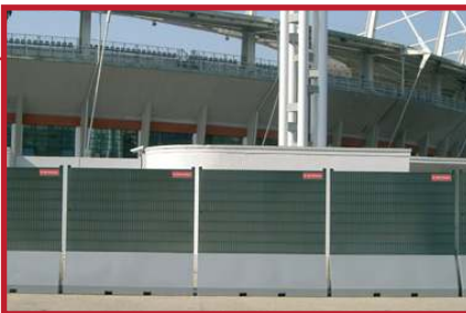
Bildet viser gjerdet med 2D netting og plate. Egnert der man ønsker å skjerm området og hindre innsyn. Elementene kan settes helt inntil hverandre uten åpning imellom.