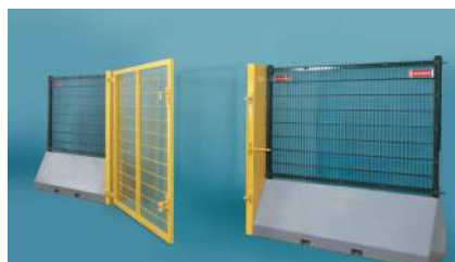
En- og tofløyet port er tilgjengelig. Monteres direkte på gjerde-elementene.