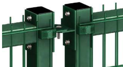
Gjerdene kobles enkelt sammen i toppen. For å unngå avstand mellom elementene, trenger ikke denne koblingen å benyttes.