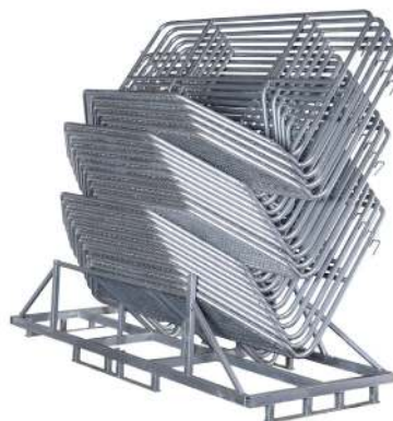
Transport- og oppbevaringspall for stive gjerder (tar 25 stk)