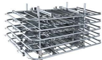
Transport- og oppbevaringspall for sammenleggbare gjerder (tar 5 stk)