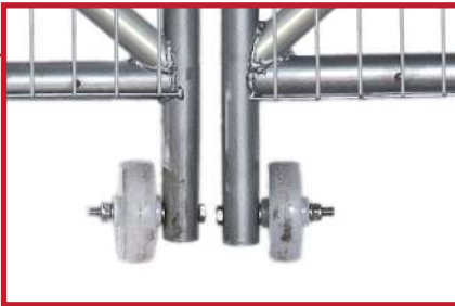
To hjul gjør det enkelt å åpne og lukke porten.