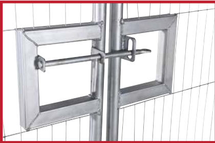
Porten er utstyrt med låsepinne for enkel og effektiv stenging med hengelås.

SmartWeld-panel: Avrundet ende gir 70 % sterkere sveiseskjøter enn tradisjonelle panel, testet for belastning med 500 kg trykk, hver enkelt tråd er sveiset på for å gi ekstra styrke og kvalitet.