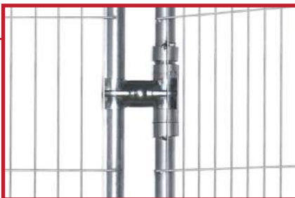
Porten settes enkelt sammen med byggegjerder ved hjelp av festeklammer.