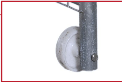
Hjulet gjør det enkelt å åpne og lukke porten.