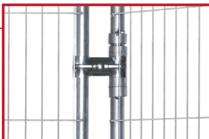
Porten settes enkelt sammen med byggegjerder ved hjelp av standard festeklammer.