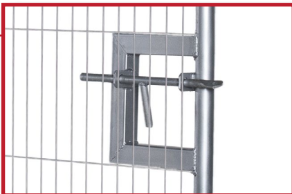
Porten er utstyrt med låsepinne for enkel og effektiv stenging med hengelås.